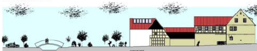
Planung Schuhmacherhaus © Arch. Bergmann, Hofheim